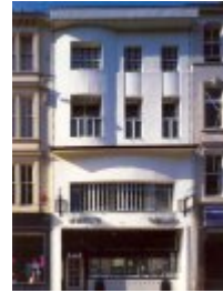
The Willow Tea Room (1904)