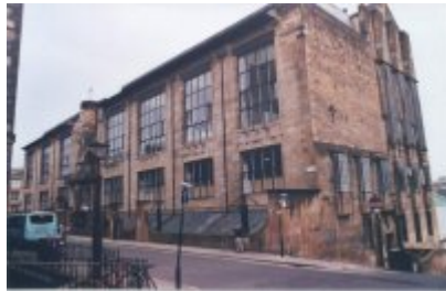
School of Art (1899)

Mackintosh es mucho menos ornamental que otros de sus contemporáneos modernistas, como Gaudí en Barcelona o Victor Horta en París. El proyecto se concluyó en dos partes: la primera, entre 1897-99, constaba de talleres, la oficina del director, una sala de exhibición, servicios y la vivienda del guardián. La segunda, entre 1907-09, incluyó nuevos talleres, una biblioteca, auditorio y un salón de reuniones.