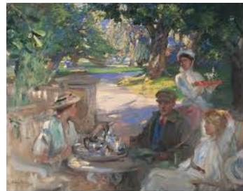
bourne fine art