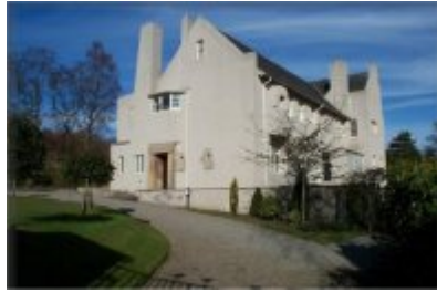
Hill House (1903)