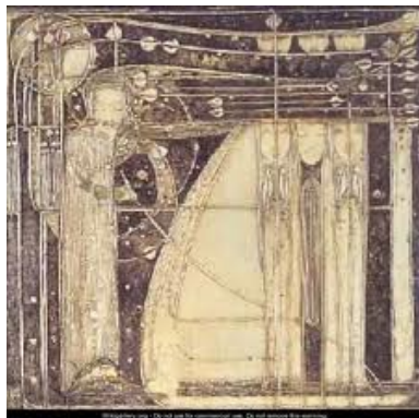
wiky galery org