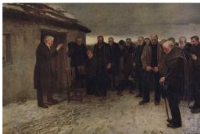
garden of praise