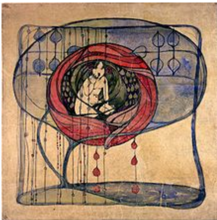
Frances MacDonald: Girl in a tree.

La Escuela de Glasgow ( Glasgow School ) fue un círculo de influyentes artistas modernos y diseñadores que comenzaron a trabajar en Glasgow, Escocia en los años 1870 , y florecieron desde los años 1890 hasta alrededor de 1910 . Glasgow experimentó un boom económico a finales del siglo XIX , de lo que resultó en un estallido de significativas contribuciones al movimiento Art Nouveau , particularmente en los campos de la arquitectura , diseño de interiores , y pintura .