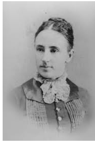
lib iastate ed