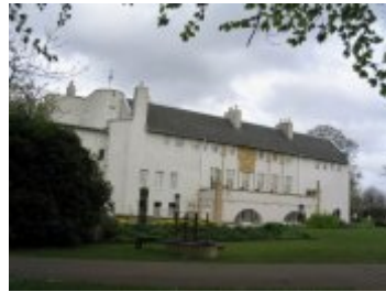
House for an Art Lover (1901)