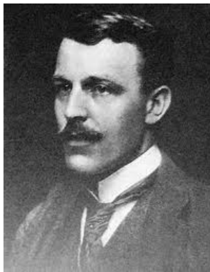
golden age paintings blogspot

Pintor. Nació en Greenock . Guthrie se convirtió en uno de los más progresistas de los escoceses pintores del siglo 19. Eligió a sus súbditos de la vida cotidiana, un funeral Highland (1881) fue ampliamente considerado como una obra maestra y se ha celebrado hoy por la Galería de Arte de Glasgow. Después de establecerse en Cockburnspath ( Borders ) en 1883, Guthrie produjo sus obras más influyentes. El abrazó la creación, siendo el primero de los "Glasgow Boys" para ser elegido miembro de la Royal Scottish Academy (1888). Con esto renunció a su postura progresista y un grado de conservadurismo deslizado en su trabajo. Se convirtió en Presidente de la RSA en 1902, sucediendo a Sir George Reid (1841 - 1913), y utilizó esa posición para lograr mejoras en las instalaciones de las Galerías Nacionales de Escocia.