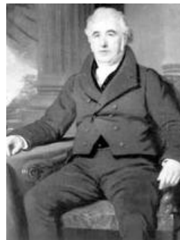
eng 1september ru